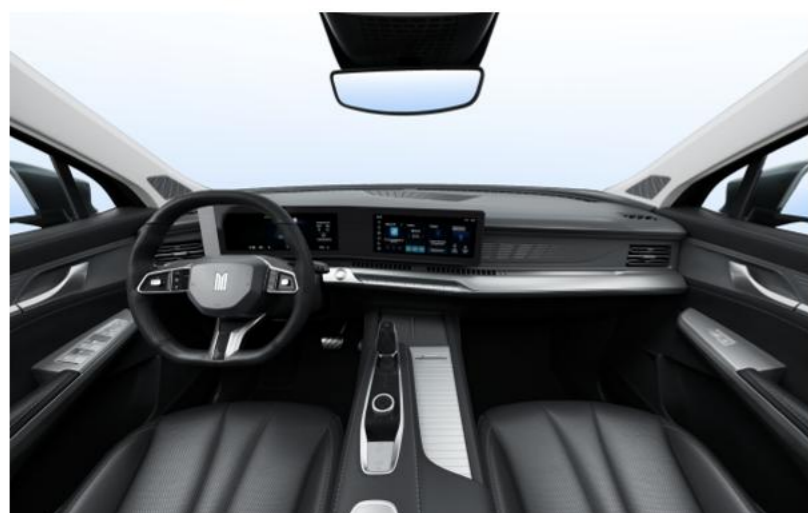
Чёрная обивка салона