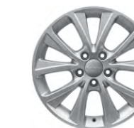
17-дюймовые литые диски

*Опция доступна не во всех комплектациях. Подробности уточняйте в дилерских центрах и на сайте haval.ru . Приведенные данные основаны на серийном автомобиле, не являются характеристиками одного конкретного автомобиля, носят информационный характер, ни при каких условиях не являются публичной офертой, служат лишь для иллюстрации различных типов/комплектаций автомобилей. Показатели в реальной жизни могут отличаться.