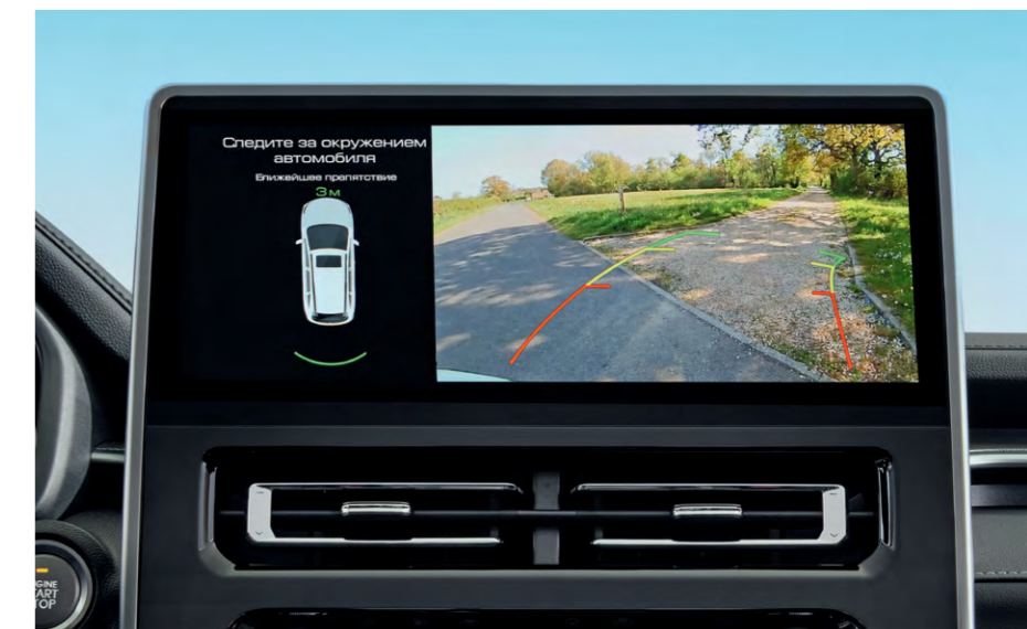
HD-камера заднего вида