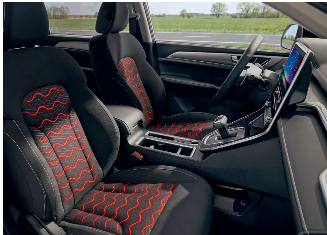
Подогрев передних сидений