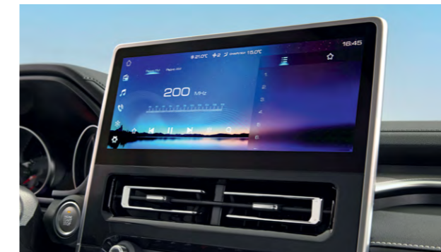
Мультимедийный экран 12,3"