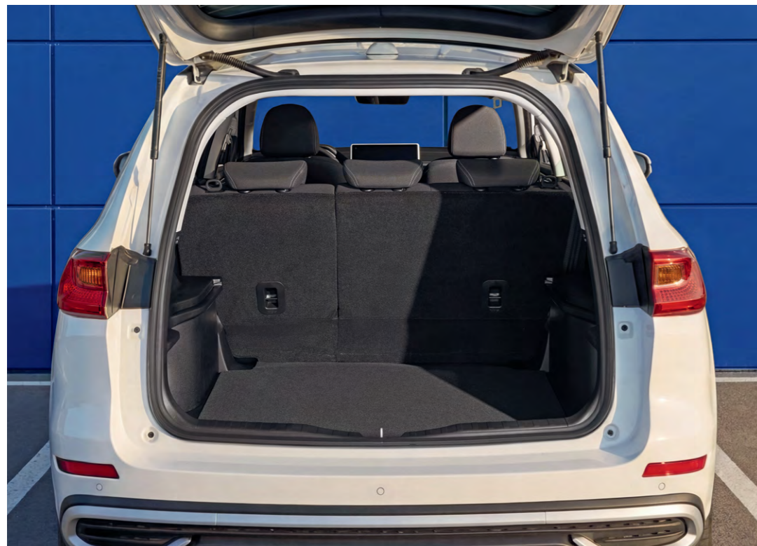
Вместительный багажник 808 / 1700 л

Особого внимания заслуживает вместительный багажник объемом 808 л, который при необходимости увеличивается до 1700 л за счет складывания заднего ряда сидений. Ручка багажника расположена высоко, что позволяет избежать налипания грязи и сохранить руки чистыми при его открытии. Дополнительный комфорт водителю обеспечивает бокс для хранения очков, а для безопасности самых маленьких пассажиров предусмотрены крепления для детских автокресел ISOFIX.