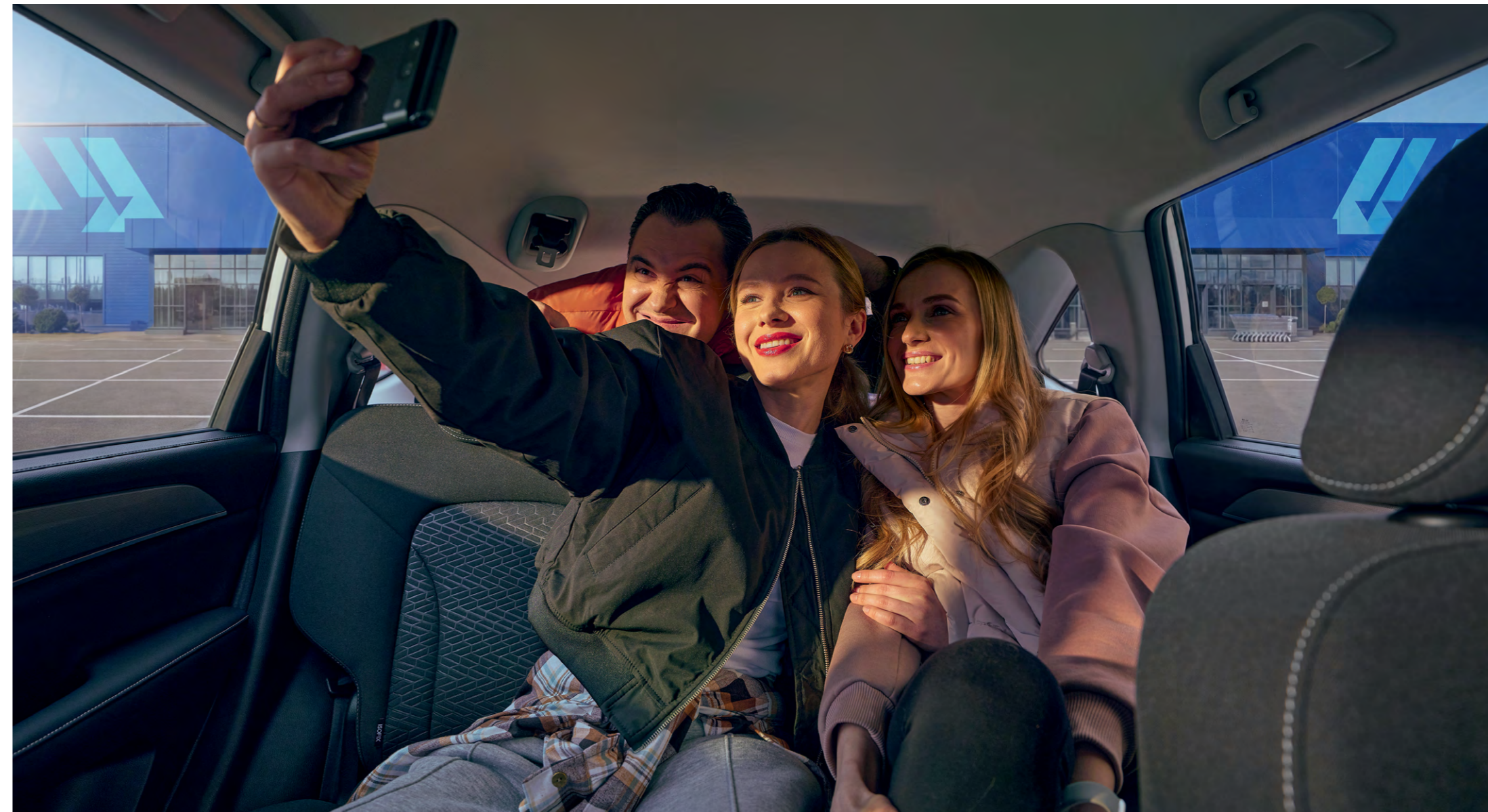
Просторный задний ряд сидений

Расширенный пакет зимних опций делает поездку на Haval M6 комфортной при любых погодных условиях. Автоматический климат-контроль, многоуровневый подогрев передних сидений, зеркал и трехуровневый подогрев руля позволяют быстро адаптироваться к капризам погоды. А просторный задний ряд сидений позволяет взять с собой в дорогу компанию друзей, разделяющих ваши интересы.