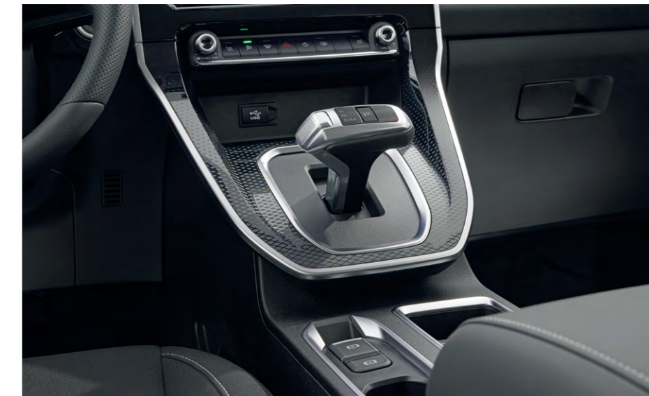
Роботизированная коробка передач*

За уверенный разгон и плавное движение кроссовера отвечает роботизированная коробка передач, а за комфортное путешествие на дальние дистанции — круиз-контроль. Тыл Haval M6 прикрывает HD-камера заднего вида с динамической разметкой делает парковку и движение задним ходом еще более удобным и безопасным.