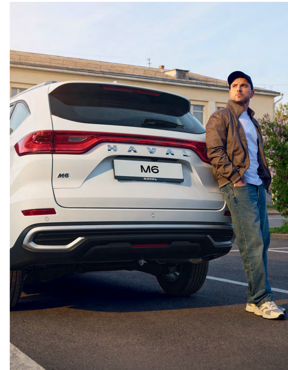
Дизайн задних фонарей

Благодаря продуманным деталям экстерьера кроссовер выглядит современно и привлекательно. Светодиодная оптика с дневными ходовыми огнями, противотуманные фары и задние фонари освежают облик автомобиля, позволяя взглянуть на Haval M6 под новым углом. Дизайн 17-дюймовых дисков специально разработан для России. Внушительные колеса визуально подчеркивают габариты автомобиля и с легкостью преодолевают городские дорожные препятствия и загородное бездорожье.