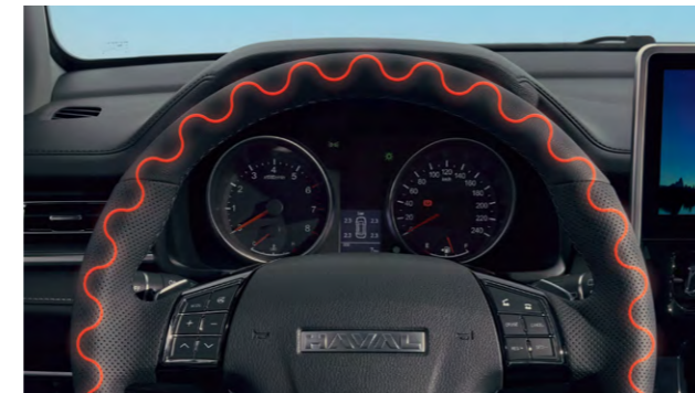
Руль с подогревом