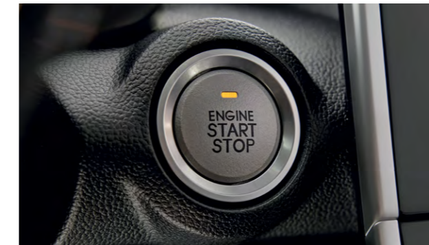
Запуск двигателя с кнопки

В просторном салоне кроссовера есть всё необходимое для удобства в пути. В карманах дверей достаточно мест для хранения, а спереди и сзади в автомобиле имеются USB-разъемы. На приборной панели удобно расположен экран мультимедиа 12,3". Функция запуска двигателя с кнопки делает старт простым и приятным, а подключение гаджетов через Bluetooth открывает множество новых возможностей.