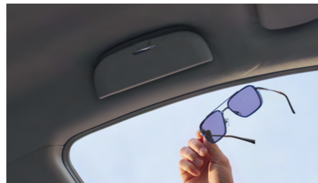
Бокс для очков

Особого внимания заслуживает вместительный багажник объемом 808 л, который при необходимости увеличивается до 1700 л за счет складывания заднего ряда сидений. Ручка багажника расположена высоко, что позволяет избежать налипания грязи и сохранить руки чистыми при его открытии. Дополнительный комфорт водителю обеспечивает бокс для хранения очков, а для безопасности самых маленьких пассажиров предусмотрены крепления для детских автокресел ISOFIX.