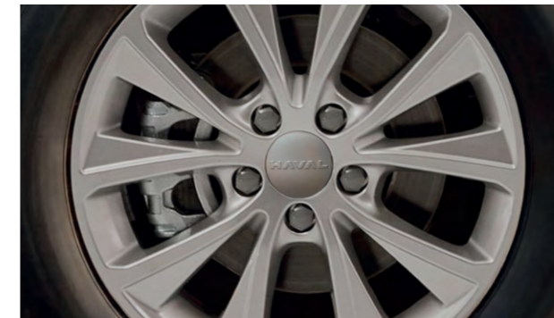
Колесные диски 17"

Благодаря продуманным деталям экстерьера кроссовер выглядит современно и привлекательно. Светодиодная оптика с дневными ходовыми огнями, противотуманные фары и задние фонари освежают облик автомобиля, позволяя взглянуть на Haval M6 под новым углом. Дизайн 17-дюймовых дисков специально разработан для России. Внушительные колеса визуально подчеркивают габариты автомобиля и с легкостью преодолевают городские дорожные препятствия и загородное бездорожье.