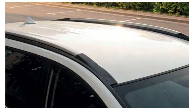
Рейлинги для перевозки грузов