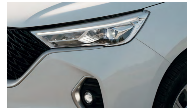
Передняя светодиодная оптика