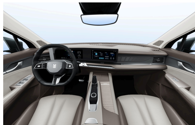
Бежевая обивка салона