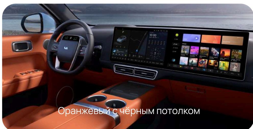
Оранжевый с чёрным потолком