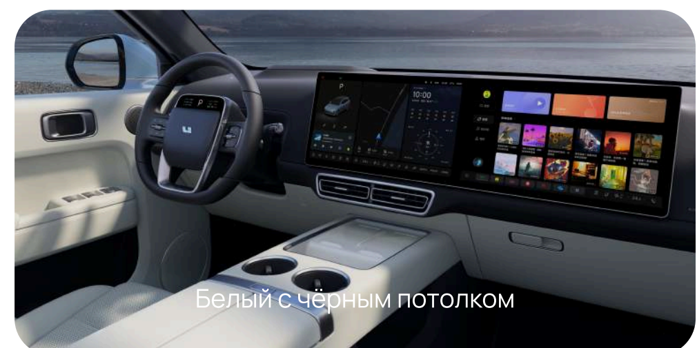
Белый с чёрным потолком