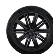
Чёрные колёсные диски R21 с всесезонными шинами