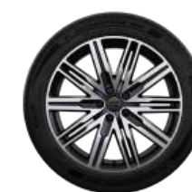
Двухцветные колёсные диски R21 с всесезонными шинами