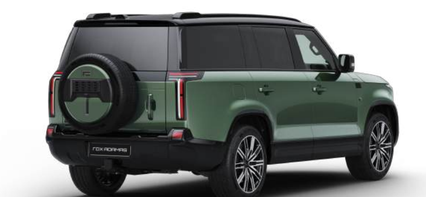
Полноразмерное внешнее запасное колесо с защитным чехлом