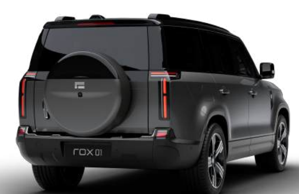
Полноразмерное внешнее запасное колесо с чехлом