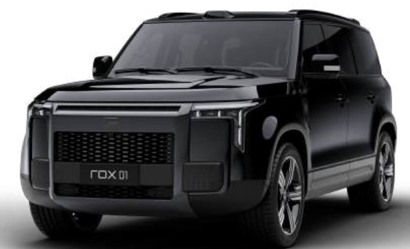
Чёрный бриллиант (Опция) 1