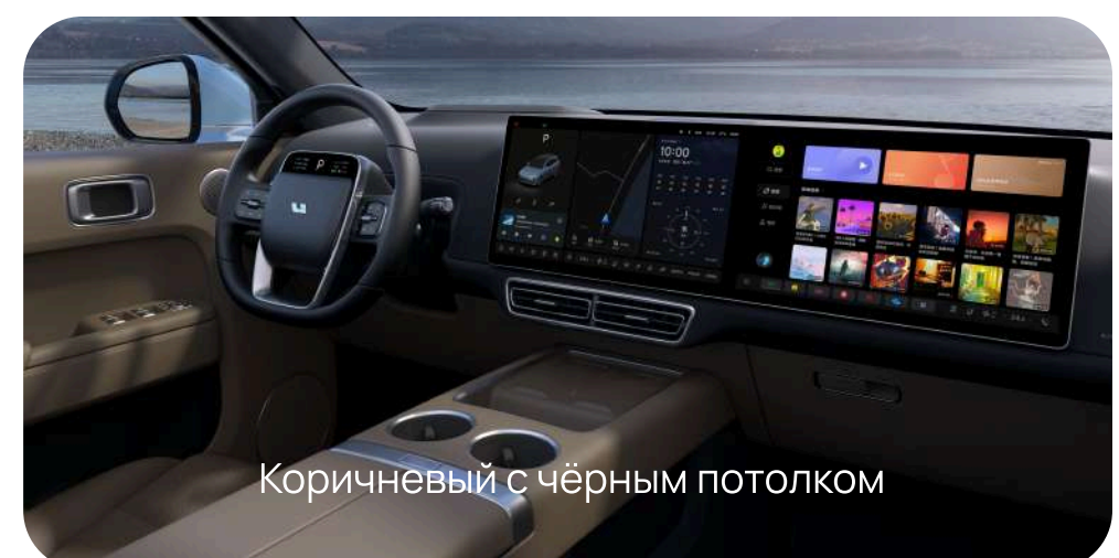
Коричневый с чёрным потолком