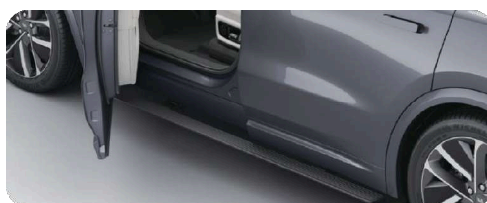
Выдвижные пороги с электроприводом 2