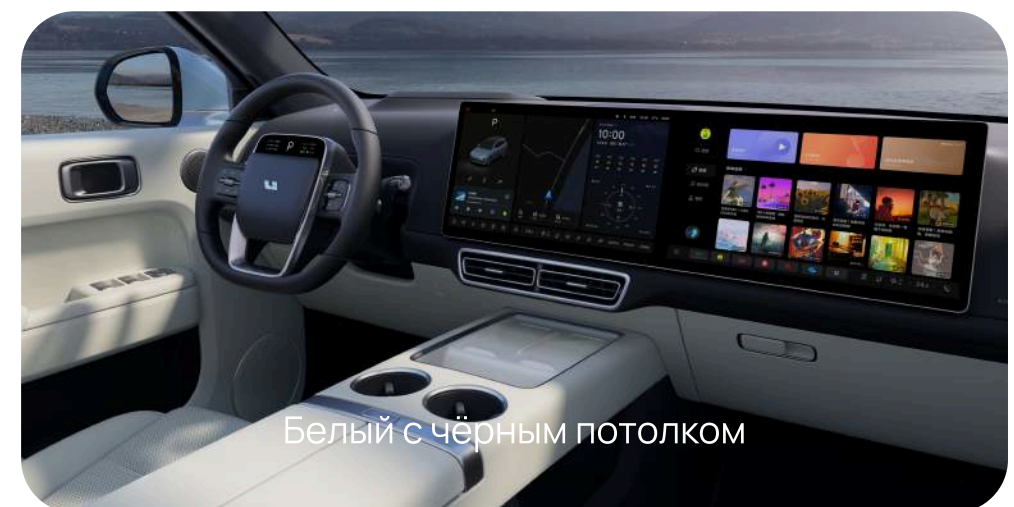
Белый с чёрным потолком