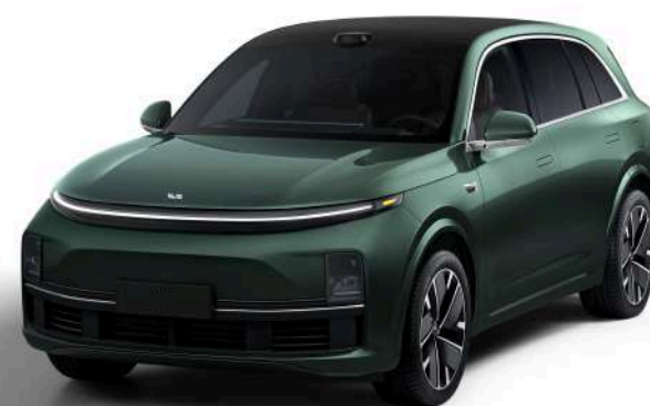
Глубокий зелёный перламутровый - Особая серия 1