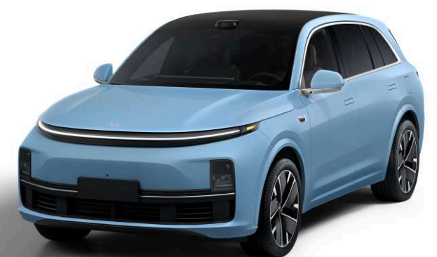
Голубой перламутровый - Особая серия 1