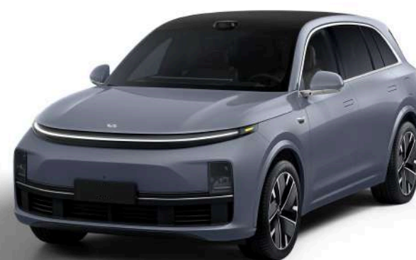
Серо-голубой - Особая серия 1