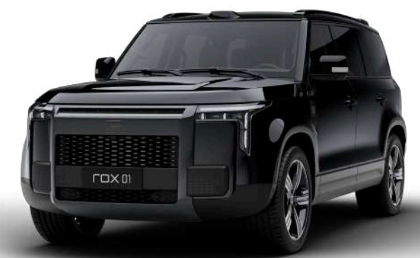
Чёрный бриллиант (Опция) 1