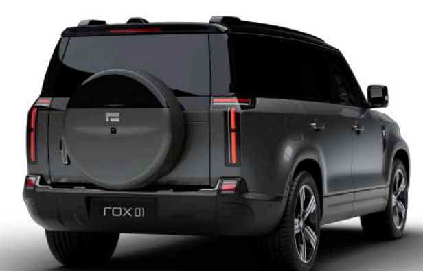
Полноразмерное внешнее запасное колесо с чехлом