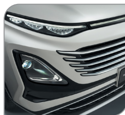
Автоматический свет фар с регулировкой по высоте и задержкой выключения