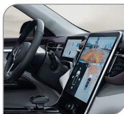
Камера 540° (круговая камера 360° + камера «сквозь» 180°)