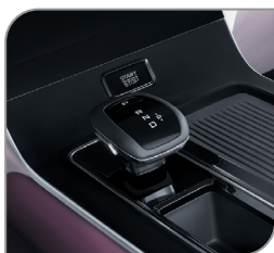
8-ступенчатый автомат AISIN