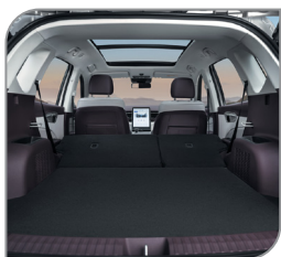
Багажник 560 или 1345 литров при сложенных задних сидениях